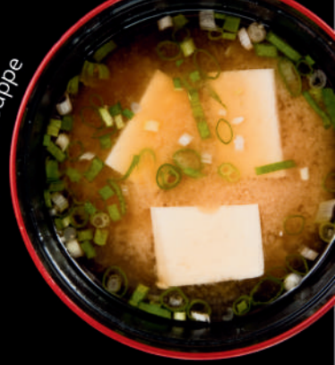
2. Miso Suppe