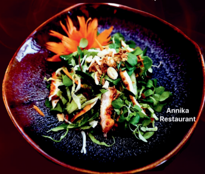
14. Salat Mien